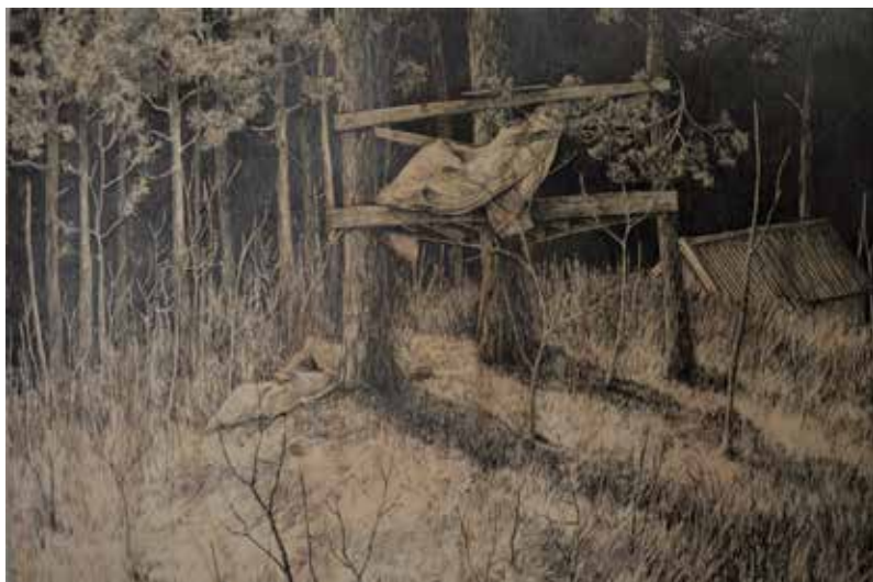
A perfect bit behind, blyerts på trä, 60 x 75 cm

Med hjälp av Pingels ungdomsstipendium vill du utveckla ditt konstnärliga arbete såsom deltagare i kulturprojektet Tomma rum under sommaren. Vi ser fram emot resultatet när hösten kommer!