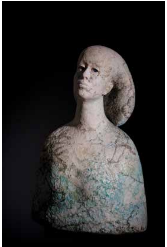
Under körbärsträdet, stengods, höjd 64 cm

Med glädje stödjer Värmlands Konstförening din "kreativa inandning" med ett stipendium ur Åke Lekmans fond.