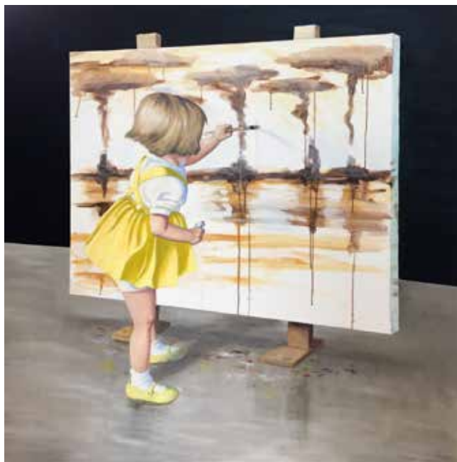
Jag ska måla hela världen lilla mamma..., tempera/olja, 120 x 120 cm