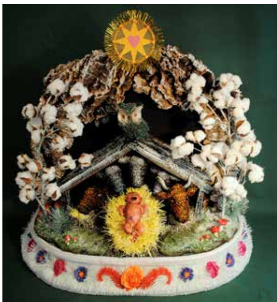
Flickan i krubban, blandteknik (2013)

Men det är för dina mångåriga inpass i det värmländska konstlivet, med kombinationen glamour och vardag, humor och värme, som vi tilldelar dig vårt stora konstnärstipendium!