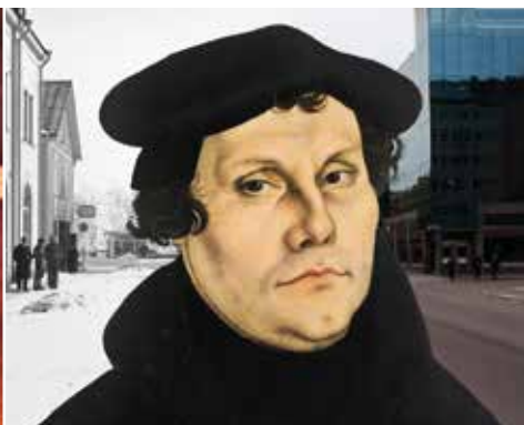
DET DOLDA ARVET 14.10 - 8.4 2018 Martin Luther och Sverige

utställningar • kulturmiljöer • restaurang • kafé butik • program • möten & konferens • guidade visningar