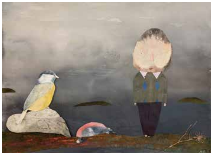
Jag var, du är. Blandteknik, collage, 79 x 57 cm

Vi visar vår uppskattning med ett Thor Fagerkvist-stipendium!