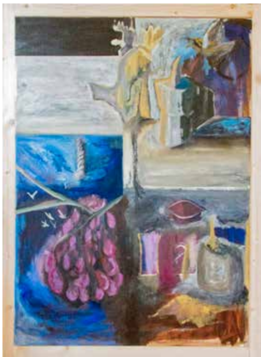
Tre jagare (under process). Olja på juteväv, 72 x 98 cm.

Vi tycker att projektet låter både ambitiöst och spännande, och bidrar gärna till finansieringen med vårt Pingels ungdomsstipendium!