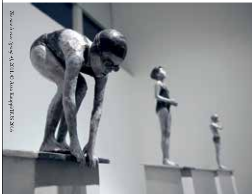
The race is over (Group A), 2011. © Assa Kauppi/BIUS 2016

The race is over – I'll protect you from what you want 1 oktober – 27 november