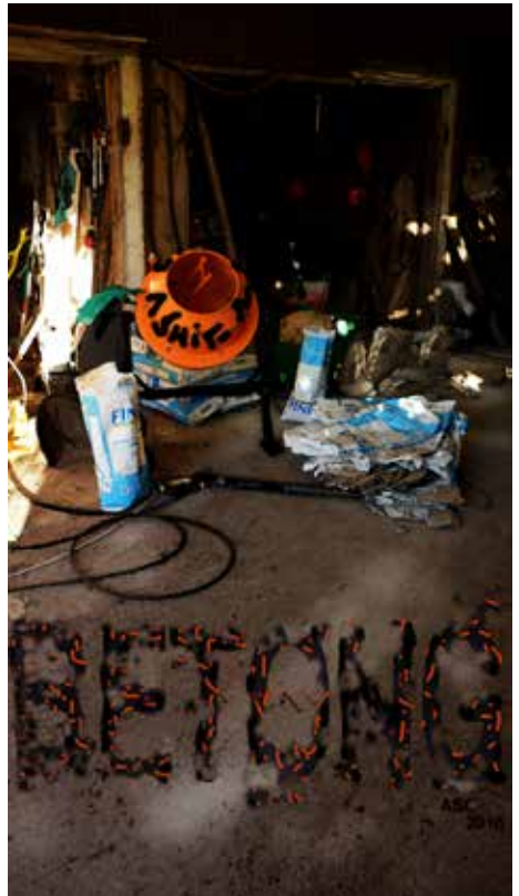
Betong – under produktion

Såsom holländsk invandrare sen mitten av 1970-talet har du varit och är en ovärderlig tillgång för det värmländska konstlivet, vilket Värmlands Konstförening äntligen vill belöna.