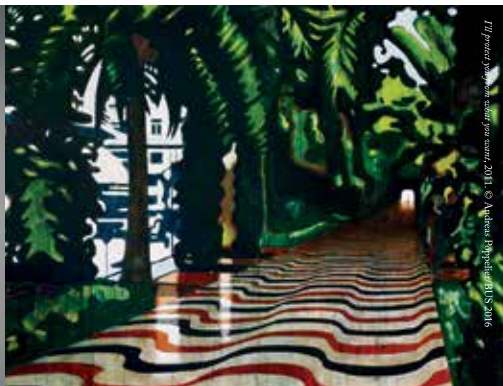
I'll protect you from what you want, 2016. © Andreas Poppelier/BIUS 2016

Kristinehamns konstmuseum ✕ kristinehamnskonstmuseum.com 0550-882 00 En del av Kristinehamns kommun. Med stöd av Region Värmland.