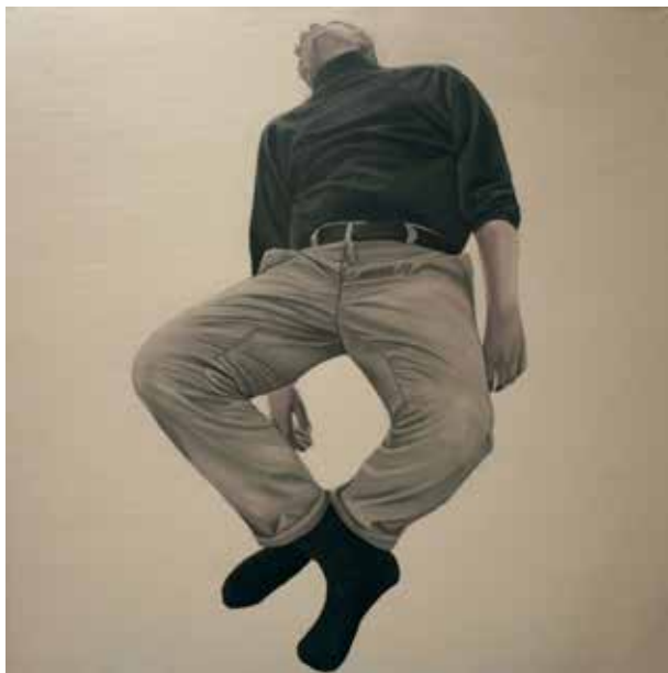
Som om ditt blod har stannat, olja, 80x80 cm

Värmlands Konstförening önskar dig lycka till i framtiden!