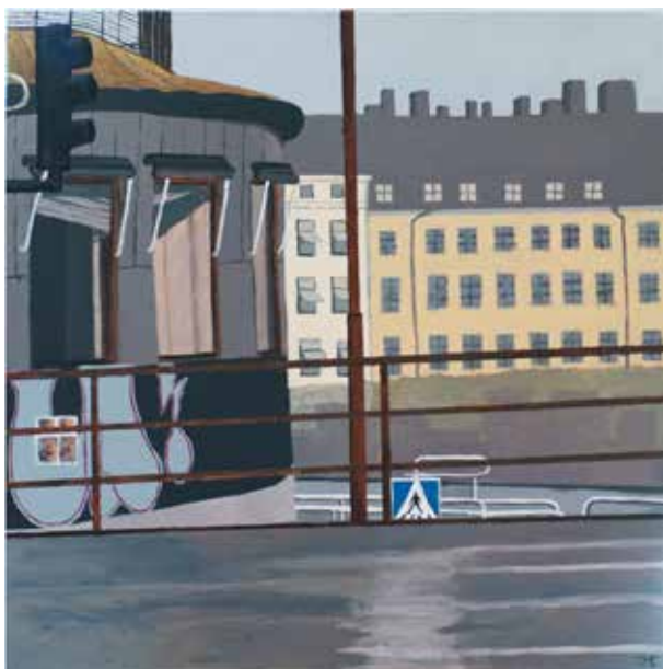
Kolingsborg/Slussen, akryl, 40x40 cm

Värmlands Konstförening önskar dig lycka till och ser fram emot dina bilder på kommande höstsalong.