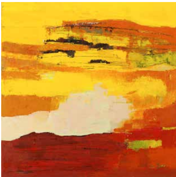
Från Valön, olja, 100x100 cm

Det är mot den bakgrunden samt för ditt förtjänstfulla konstnärskap som Värmlands Konstförening har glädjen att överlämna ett Thor Fagerkvist-stipendium till dig.