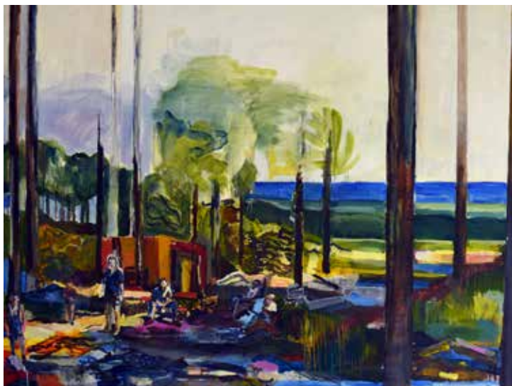
The Others, akryl på duk, 150 x 115 cm

Du är trygg i din stil, har med åren vågat gå upp i både färg och format, och har som mogen konstnär alltså gjort dig förtjänt av vårt Thor Fagerkvist-stipendium!