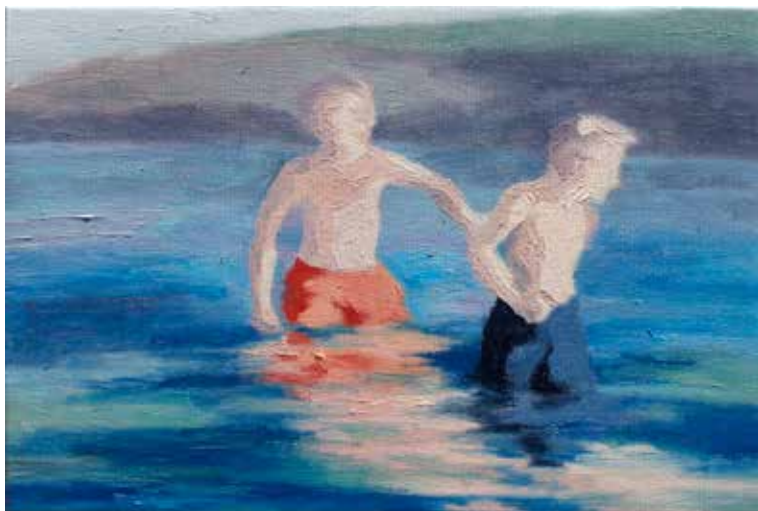
Nr. 3 ur serien Beach 2018, olja på duk, 30 x 20 cm

Vi stödjer dig med vårt ungdomsstipendium i arbetet med att se vad du kan hitta i ytorna och önskar lycka till!