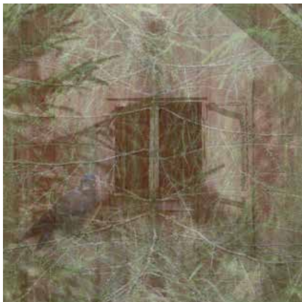
Abandoned, foto på aluminium/dibond, 75 x 75 cm

Med broderi, textila skulpturer, foton, mixed media och ett nyfiket letande efter nya uttryck är du en ambitiös konstnär hela tiden på väg. I backspegeln ser vi i Värmlands Konstförening rika spår av dig i ditt konstnärliga utövande och för detta vill vi ge dig ett Thor Fagerkvist-stipendium.